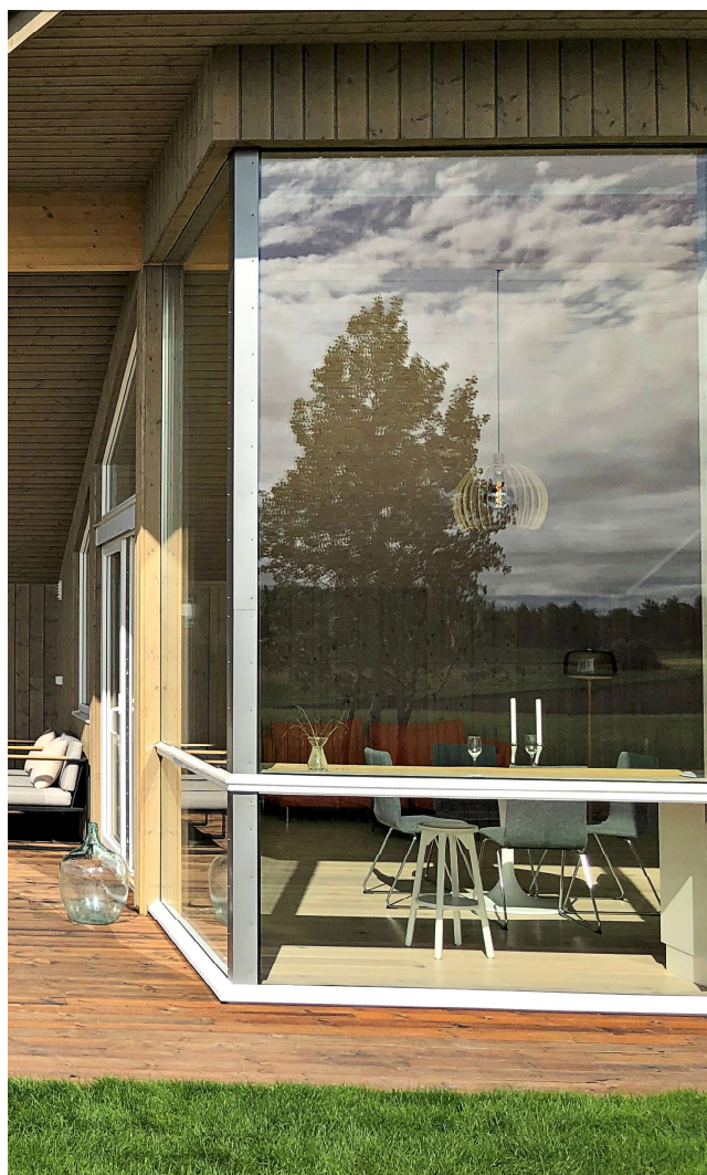
er i gang med Frostas største utbygging av bolig- og fritidsboliger og mener